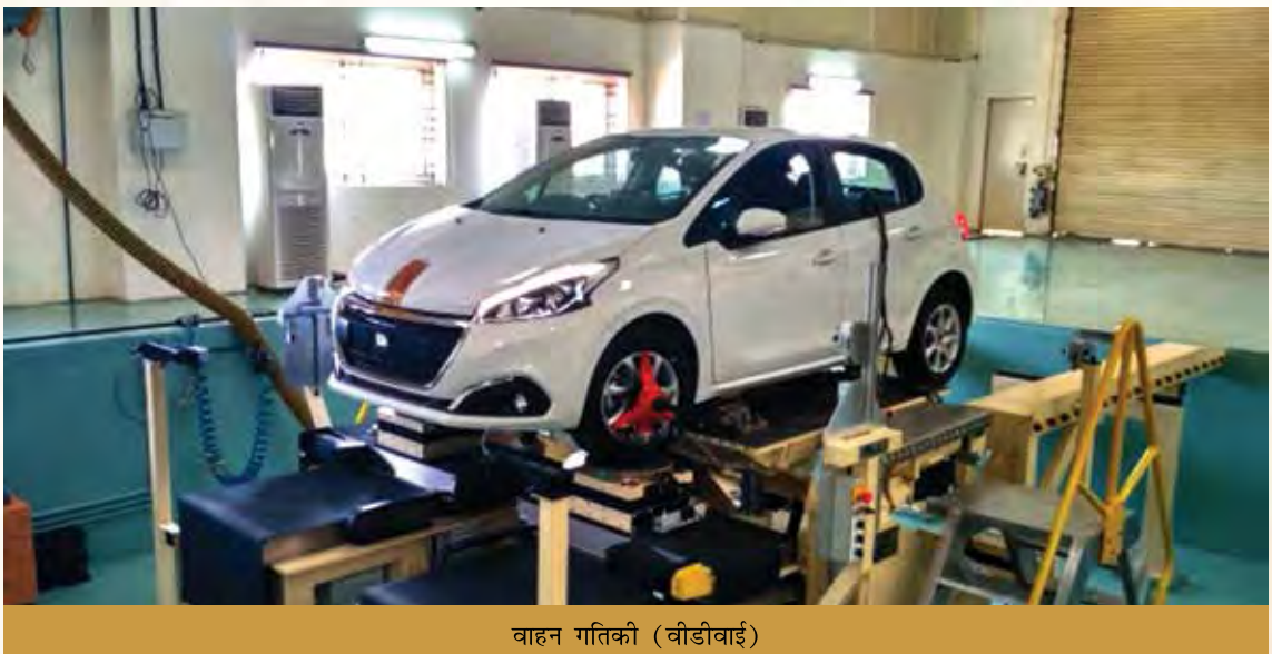
वाहन गतिकी (वीडीवाई)