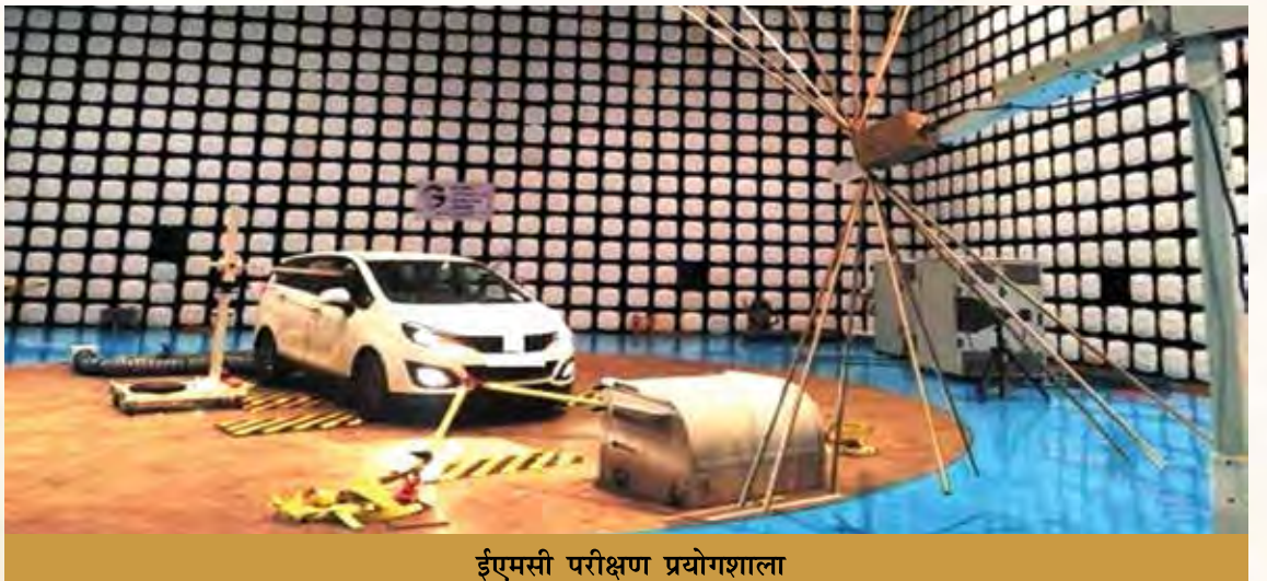
ईएमसी परीक्षण प्रयोगशाला