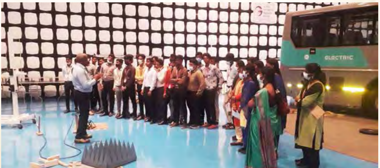
कॉलेज के छात्र जीएआरसी का दौरा करते हुए