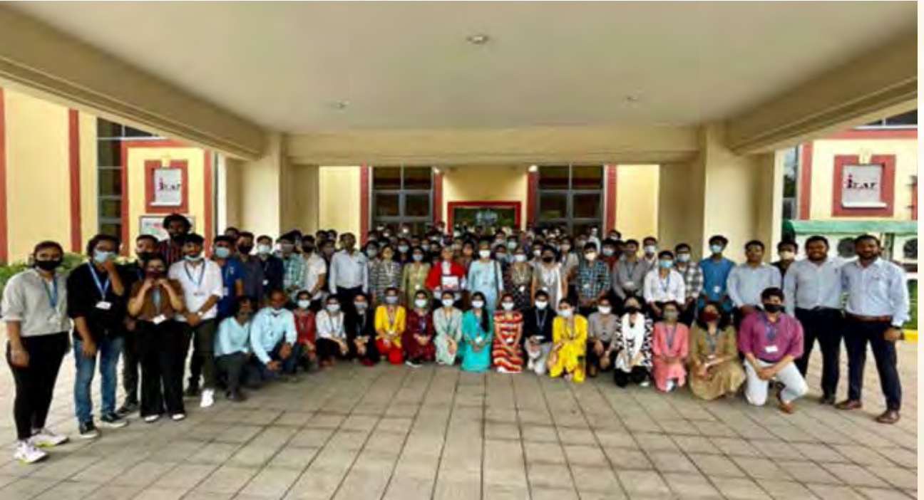
आईकैट वर्ल्ड पीस यूनिवर्सिटी के छात्रों का दौरा

(क) 'सभी महिलाएं अविश्वसनीय हैं और आईकैट को उनमें से कुछ पर गर्व है'। आईकैट, मानेसर ने मानेसर