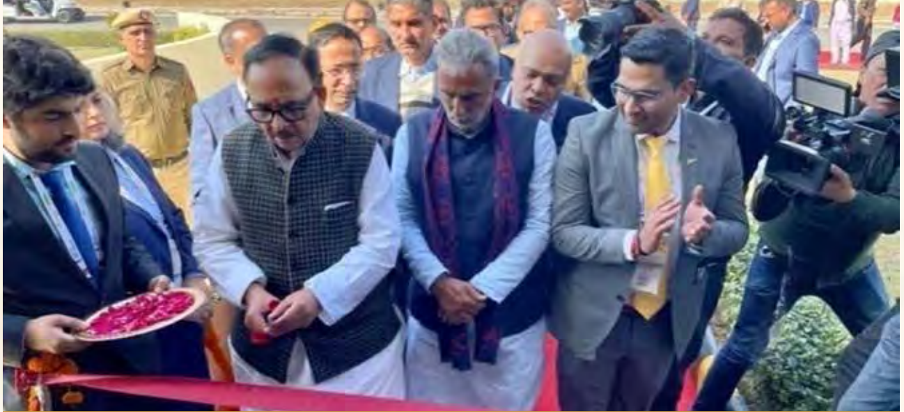
इन्क्यूबेशन एवं एक्सेलेरेशन सेंटर का उद्घाटन

(क) नई सुविधाओं का उद्घाटन: 4 फरवरी 2023 को भव्य कार्यक्रम 'पंचामृत की ओर' के दौरान, आईकैट इनक्यूबेशन एंड एक्सेलेरेशन सेंटर का उद्घाटन डॉ. महेंद्र नाथ पांडे, माननीय मंत्री (भारी उद्योग) और श्री कृष्ण पाल गुर्जर, माननीय राज्य मंत्री भारी उद्योग द्वारा किया गया। इस केंद्र का उद्देश्य