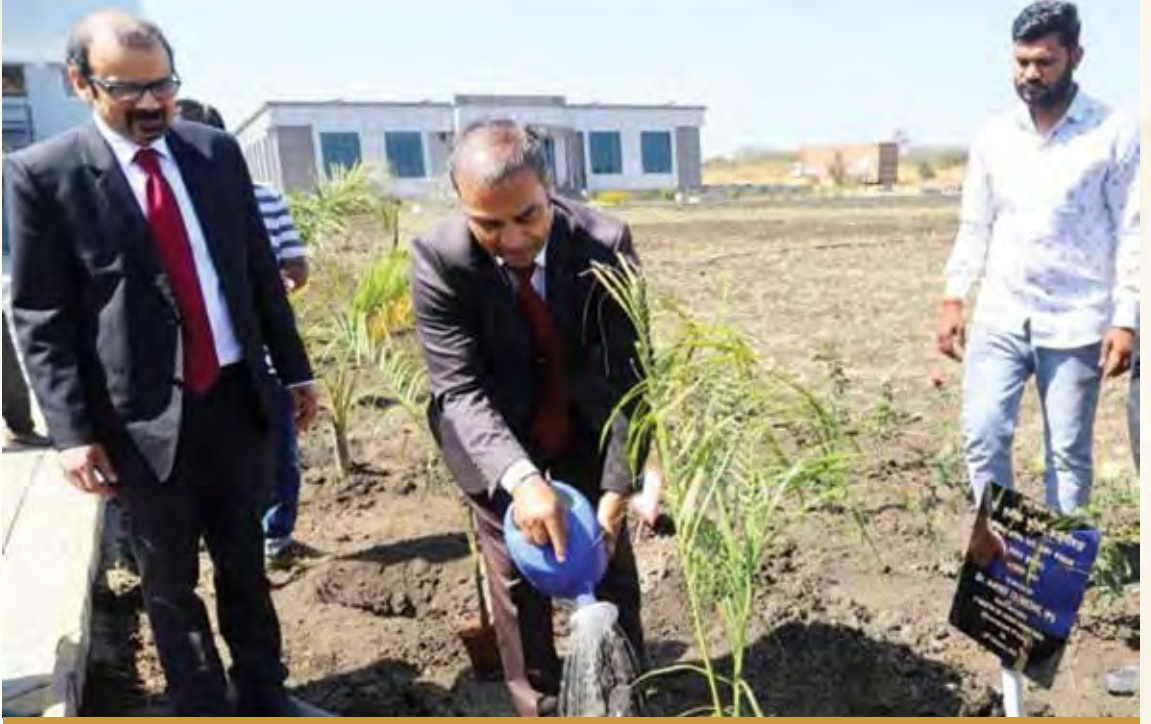
संयुक्त सचिव द्वारा वृक्षारोपण