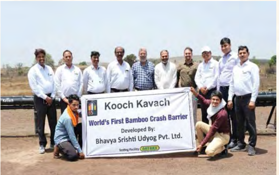
क्रैश बैरियर 'कूच कवच' द्वारा