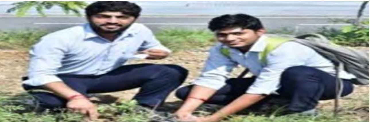
आईकैट स्थापना दिवस 'एक व्यक्ति एक पौधा'