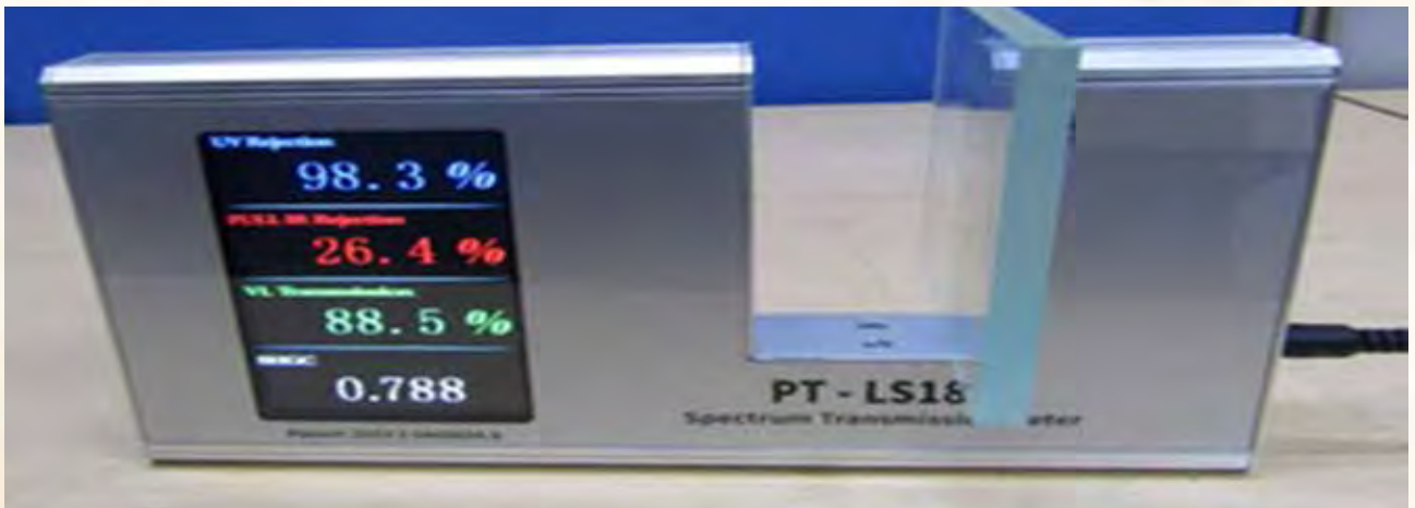
यूवी कट और आईआर कट परीक्षण सुविधा

(ख) उन्नत सुरक्षा ग्लेजिंग सामग्री के परीक्षण के लिए उदा. 3.2 मिमी तक गहरा हरा यूवी कट ग्लास (डीजीजी) और आईआर कट विंडशील्ड (पीवीबी + ग्लास) जो भारत सरकार के भारी उद्योग मंत्रालय, भारत सरकार की पीएलआई-ऑटो योजना के तहत उन्नत ऑटोमोटिव टेक्नोलॉजी (एएटी) घटक हैं के परीक्षण के लिए आईकैट-सेंटर 1 में एक सीटीएल टीम द्वारा एक समर्पित यूवी कट और आईआर कट परीक्षण सुविधा स्थापित की गई। यह परीक्षण सुविधा पीएलआई-ऑटो आवेदकों के साथ-साथ ऑटोमोटिव उद्योग को उनकी परीक्षण और सत्यापन आवश्यकताओं के लिए समर्थन देने के उद्देश्य से स्थापित की गई है। साथ ही यह अनूठी