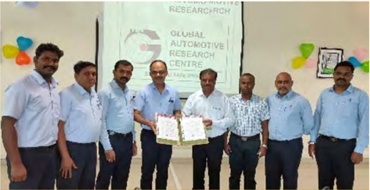
उत्सर्जन प्रकार अनुमोदन