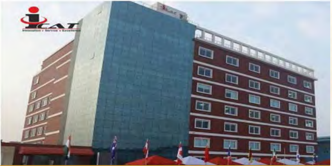
आईकैट परिसर-2, मानेसर