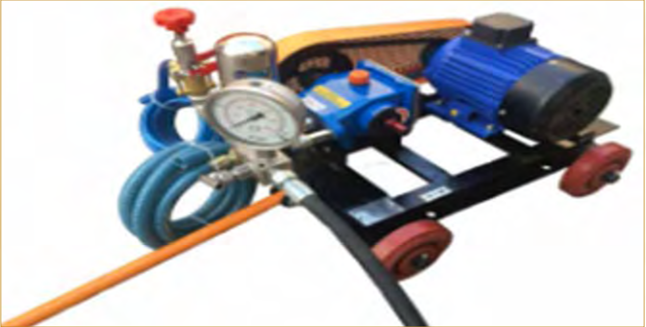
हाइड्रोस्टैटिक टेस्ट रिग

संशोधन संख्या 1, जनवरी-2022 के साथ आईकैट - सेंटर 2 में कंपोनेंट्स टेस्ट लैब (सीटीएल) द्वारा हाइड्रोस्टैटिक टेस्ट रिग और फंक्शनल टेस्ट रिग स्थापित किया गया था।