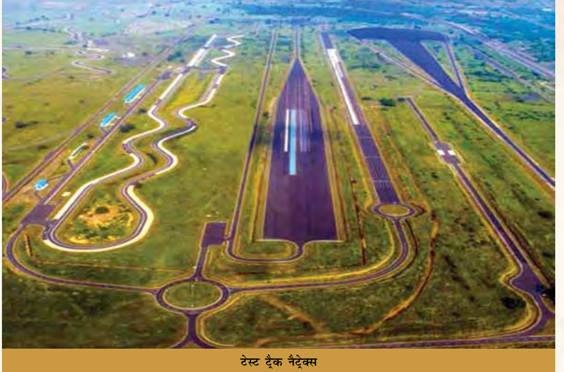
टेस्ट ट्रैक नैट्रेक्स