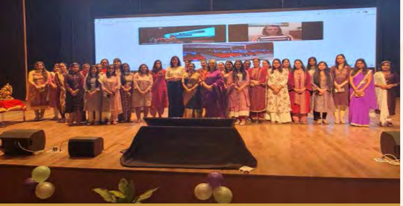
अंतरराष्ट्रीय महिला दिवस

आवश्यकताओं के अनुसार ईवी और संबंधित उभरते प्रौद्योगिकी क्षेत्र में संयुक्त अल्पकालिक और मध्यावधि पाठ्यक्रम और अनुसंधान संचालित करने के उद्देश्य से इंटरनेशनल सेंटर फॉर ऑटोमोटिव टेक्नोलॉजी (आईसीएटी) ने द नॉर्थकैप यूनिवर्सिटी (एनसीयू), गुरुग्राम के साथ एक समझौता ज्ञापन (एमओयू) पर हस्ताक्षर किए हैं।