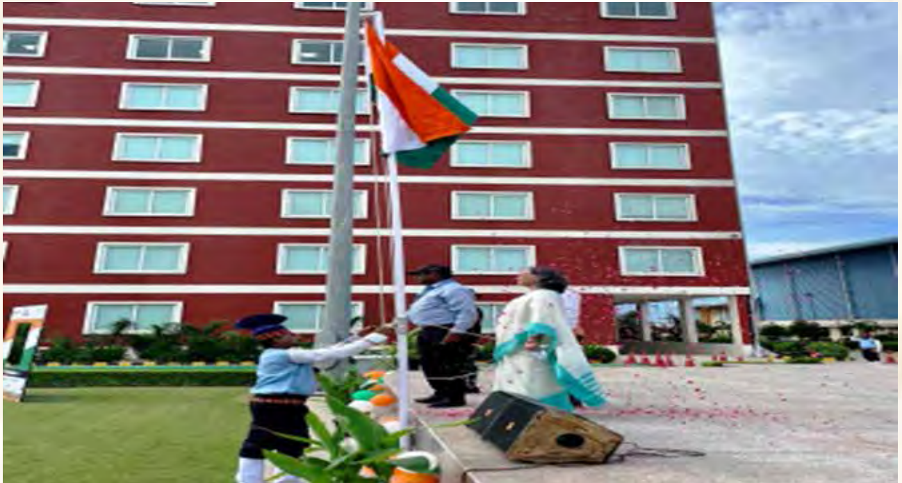
आजादी का जश्न ( हर घर तिरंगा )