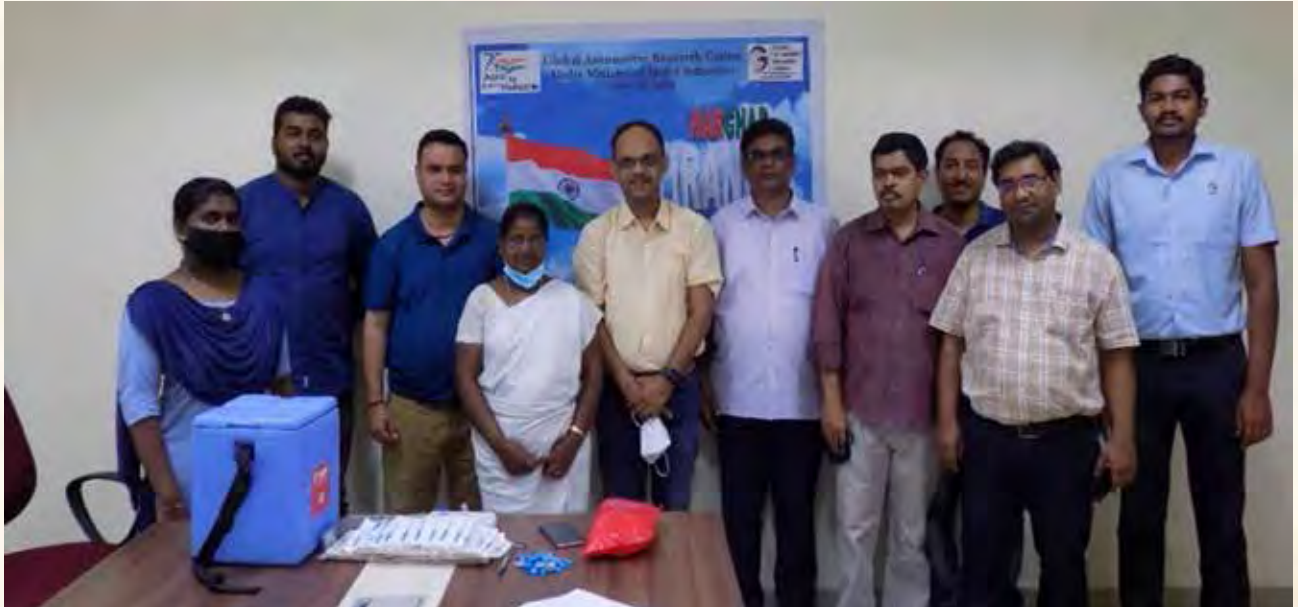
जीएआरसी में बूस्टर टीकाकरण शिविर