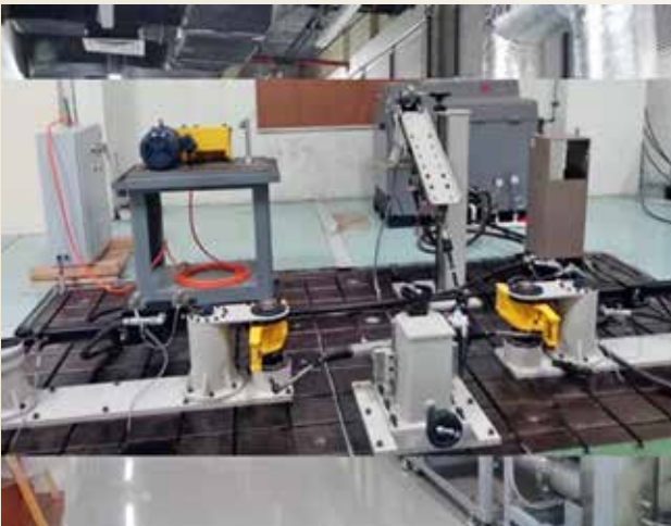
वाहन डायनेमिक्स प्रयोगशाला - स्टीयरिंग टेस्ट रिग