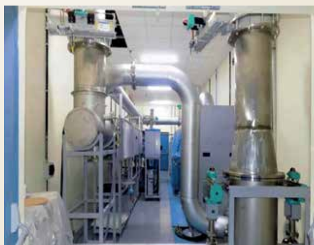
पावर ट्रेन प्रयोगशाला