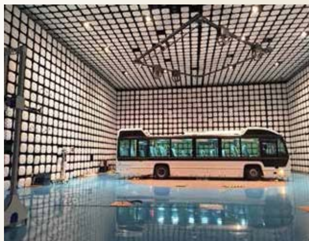
ईएमसी/ईएमआई परीक्षण प्रयोगशाला