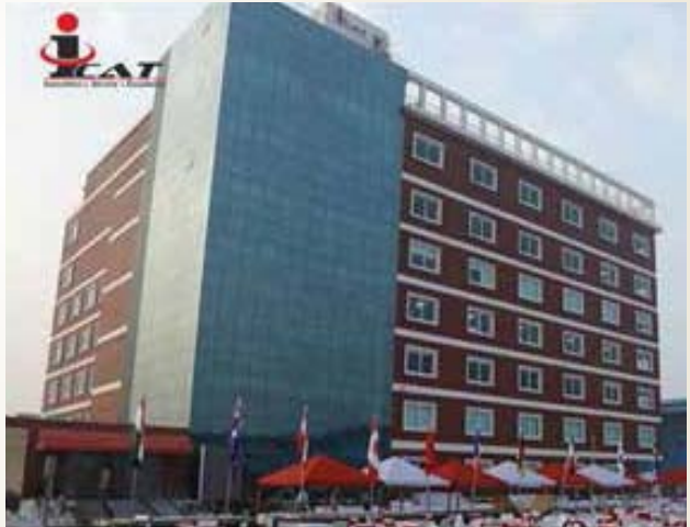
आईकैट परिसर-2, मानेसर