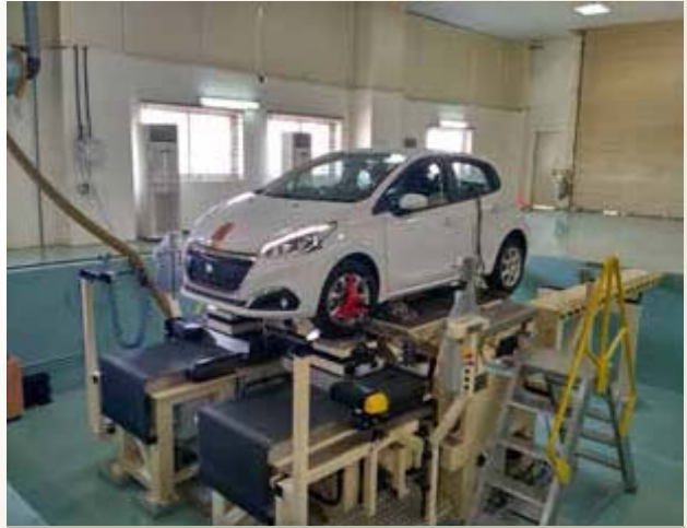
वाहन गतिकी (वीडीवाई)