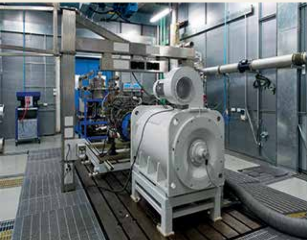
इंजन परीक्षण प्रयोगशाला