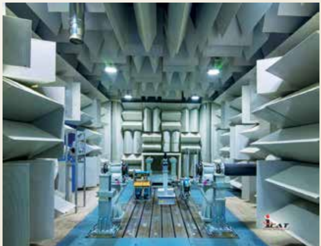
ऑटोमोटिव ट्रांसमिशन इंजन टेस्ट सेल