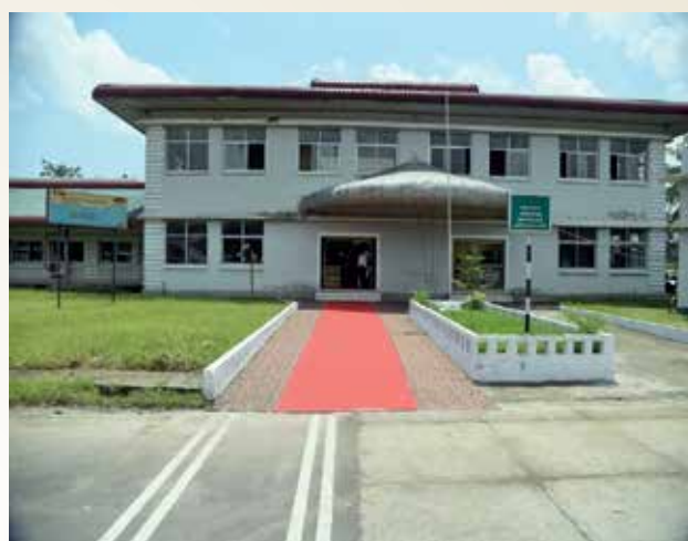
ड्राइविंग प्रशिक्षण संस्थान