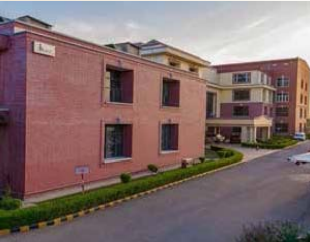
आईकैट परिसर-1, मानेसर